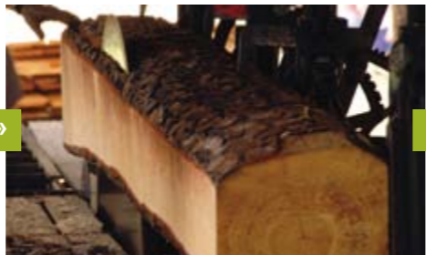
FSC certifikovaný zpracovatelský závod