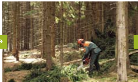
Lesní práce prováděné podle standardu FSC