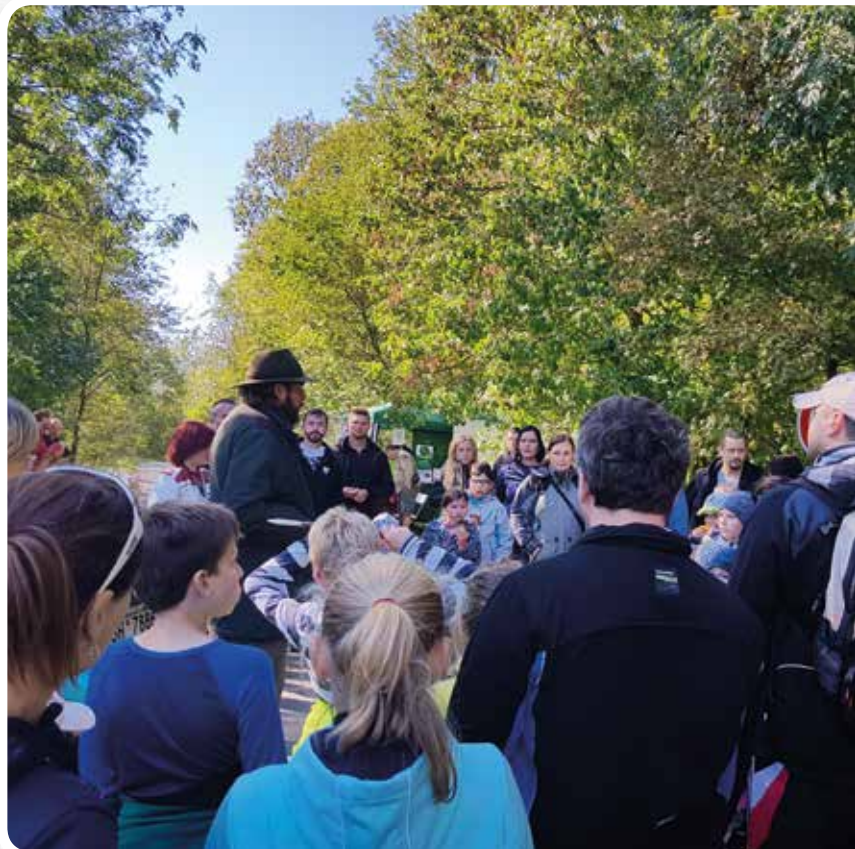
Foto: Naučná exkurze na FSC Friday v lesním majetku ŠLP Křtiny , 28. 9.

Poslední zářijový pátek, kdy se na celém světě slaví FSC Friday, jsme v brněnské čtvrti Líšeň na podporu přírodě blízkého lesního hospodaření uspořádali happening pro širokou veřejnost nazvaný „FSC na Hádech“. Jednalo se o zážitkové odpoledne s lesními exkurzemi, na kterém nechyběly hry pro děti a dospělé, soutěže o věcné ceny ani komentované prohlídky FSC certifikovaného lesa pod vedením lesníka ze Školního lesního podniku Křtiny. Akci podpořil Jihomoravský kraj, Ekocentrum Brno a Školní lesní podnik Masarykův les Křtiny.