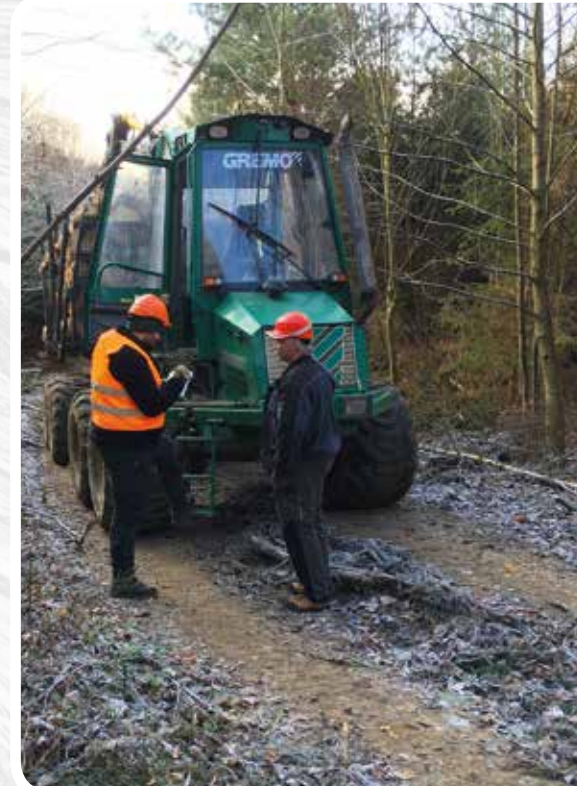
Foto: Z auditu v nově certifikovaném majetku Lesy Nový Bernštejn na Českolipsku, 29.11.